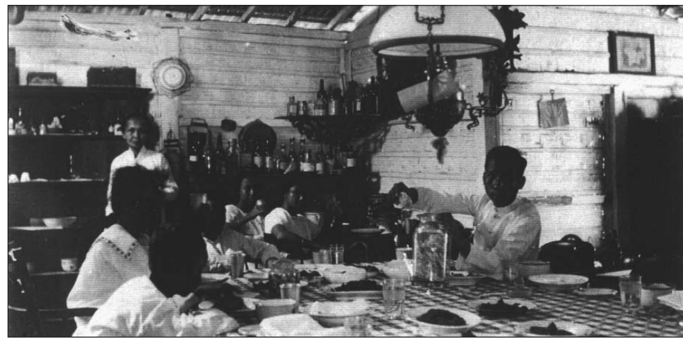
Eetkamer (voor de verbouwing van 'het grote huis'.)

We mochten terug naar huis, maar niet de deur uit. Ook niet op de straat voor het huis. Zelfs of er nog burenen in de straat woonden wisten we niet. Zo'n angst had je om rond te kijken. De Japanners en Indonesische bewakers liepen steeds heel dicht bij je. Straten en huizen staan heel ver van elkaar af, door de grote tuinen rondom. Meteen daarop is de straat aan bei-