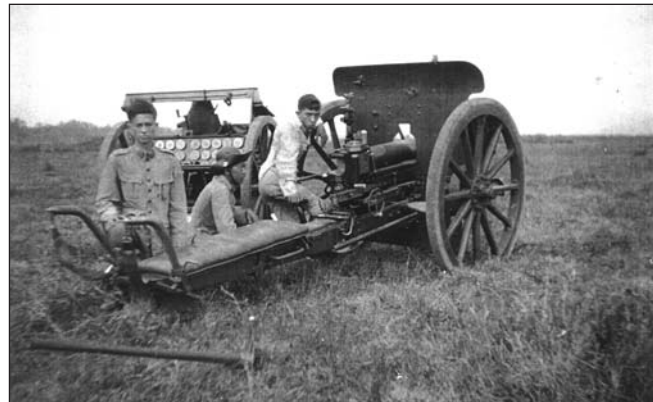
Pappie met heid.

De ouderen uit onze groep mochten mee in ossenwagens en wat we nog aan 'huisraad' kon zo ook mee. Het was een vreselijke tocht: hitte, honger en dorst maakten dat de ongeveer 17 km. een verschrikking was vooral voor de kleine kinderen. Moeders, doodop, vermagerd,