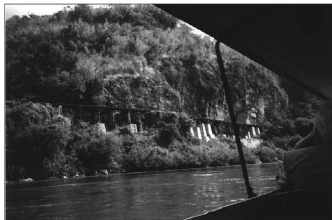
Birma spoorlijn langs de rotsen boven de rivier.

30 november 1945: getracht wordt alle burgergevangenen te bevrijden en te repatriëren.