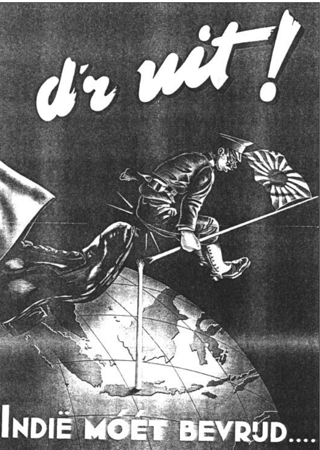
Na de overgave van Duitsland in mei 1945 werden Nederlanders opgeroepen zich als soldaat aan te melden om Indië van de Japanners te bevrijden.

Alle themapagina's zijn nu al te vinden op de homepage van de website van de gemeente: HYPERLINK "http://www.sint-michiëlsgestel.nl" www.sint-michiëlsgestel.nl Daar is ook meer informatie over de buitententoonstelling over herdenken te vinden.